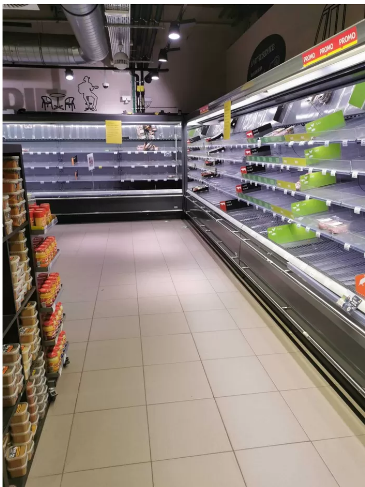
▲ Carrefour du Cimetière d'Ixelles